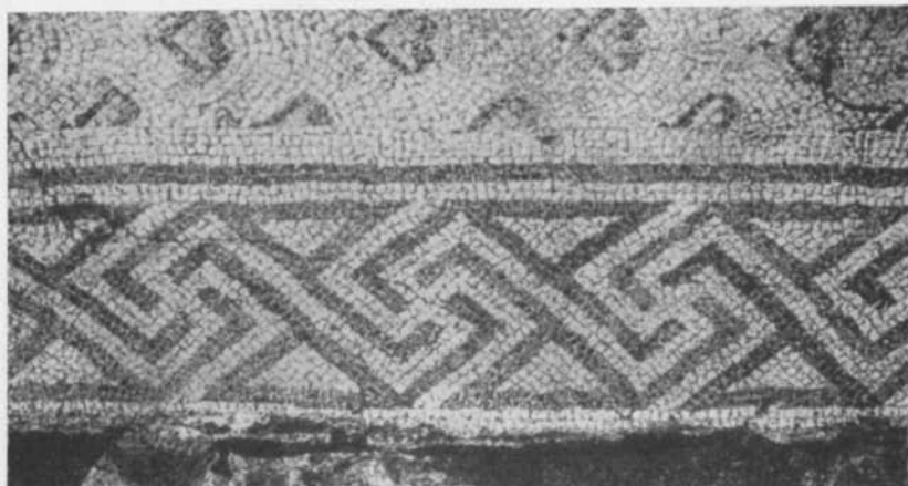
Fig. 5. Mosaik från Antiokia. Efter Levi. — Mosaik aus Antiochia.

bäst och i varje fall uppnått en viss illusionsverkan. — Huruvida bården på Hablingbo, Havor IV verkligen skall uppfattas som en meander är ovisst. I så fall skulle det vara en mycket enkel sådan. Snarare är det då ett motiv i stil med den övre bården på Burs I, d. v. s. två om varandra i vinkligna bukter böjda band. 19