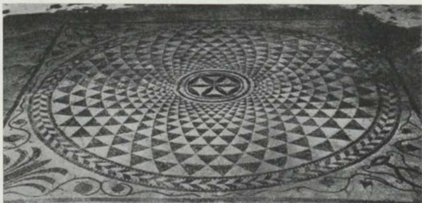
Fig. 2. Mosaik från Pompeji, Italien. Efter Blake. — Mosaik aus Pompeji, Italien.

ökad intensitet och lyster, och det hela har kommit att verka som ett mera pastost måleri, för att begagna en modern term. Men den i växlande riktningar gående sgrafferingen ger även en antydning om, att det måste ha rört sig om flera färger, åtminstone två, vare sig dessa utgjort valörer av samma färg eller blivit valda för en klarare kontrastverkans skull.