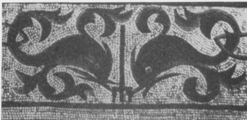
Fig. 7. Mosaik från Karthago. Efter Hinks. — Mosaik aus Carthago.

från Vallstena har på samma plats två »hästar», men att döma av deras utformning, skulle det lika väl kunna vara två omvandlade delfiner eller sjöodjur. Figureerna i de övre hörnen på Bro II får väl närmast tolkas som något feltecknade delfiner, och samma är eventuellt förhållandet med figureerna på Sanda IV.