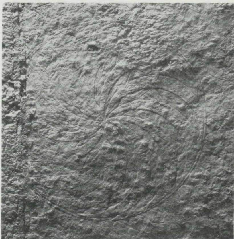
Fig. 1. Virvelrosett på bildsten från Bro sn, Gotland. — Wirbelrosette an einem Bildsteine aus dem Ksp. Bro, Gotland.

varandra. Alla dessa iakttagelser ha gjorts även av Lindqvist, men han har inte tagit upp frågan om den eventuella anledningen till detta egendomliga förfarande. Så vitt vi kunna förstå, måste konstnären i detta fall ha haft en bestämd avsikt, och denna kan knappast ha syftat till något annat än att framhäva trekantfälten. Dessa ha, med andra ord, spelat en alldeles speciell roll i kompositionen. Redan i obemålat skick ge dessa trekantfält på grund av den växlande sgrafferingen ett livfullt intryck, och denna rörlighet har säkert förstärkts genom bemålningen. Sgrafferingen har då bidragit till att ge färgen en