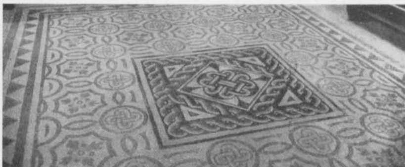
Fig. 6. Mosaik i museet, Brescia, Italien. Efter Blake. — Mosaik im Museum in Brescia, Italien.

Till slut vilja vi även nämna bårderna på stenarna Lärbro Pavals och Tingstäde XVII. 22 De ha på sidorna en rad av starkt stiliserade delfiner eller sjöhästar, vilka med all önskvärd tydlighet förkunna sitt romerska ursprung. 23 En tämligen nära liggande motsvarighet finner man på en av de romerska smyckeskivorna från Thorsberg, där en del av randzonen upptages just av en på detta sätt bildad bård. 24 Jfr även fig. 8 och 9.