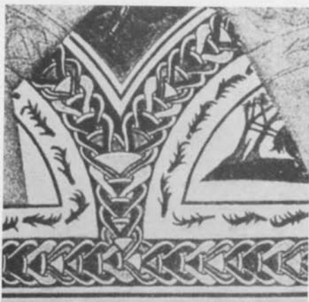
Fig. 8. Mosaik från Veji, Italien. Efter Blake. — Mosaik aus Veji, Italien.

eller, med andra ord, en gladiatorstrid. 26 De båtar, som upptaga de nedre partierna av stenarna Väskinde Björkome I och Bro I torde även kunna sammanställas med romerska farkoster, även om att det kan vara svårt att finna lämpliga paralleller. 27