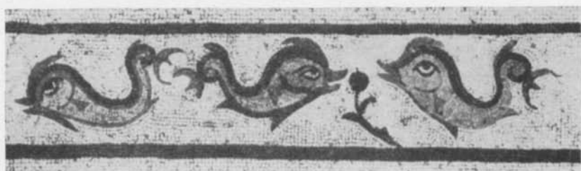
Fig. 9. Mosaik från Halikarnassos. Efter Hinks. — Mosaik aus Halikarnassos.

motsvarighet i gladiatorspele. Kanske får man även däri se en första antydning om en begynnande frigörelse från de främmande förlagorna. Redan under den närmast följande utvecklingen hade den nordiska bildkonsten hunnit långt på vägen mot en egen stil. Vi syfta därvid närmast på de i pressbleck utförda figurframställningarna på Vendeltidens hjälmar m. m.