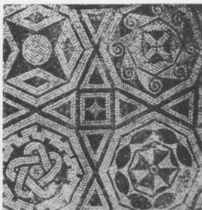
Fig. 4. Mosaik från Sette Camini, Italien. Efter Blake. — Mosaik aus Sette Camini, Italien.

mindre än hela den motivkrets, ur vilken den gotländska konstnären hämtat sin inspiration.