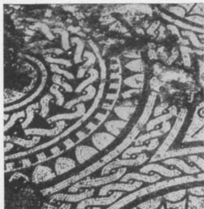
Fig. 3. Mosaik från Forlimpopoli, Italien. Efter Aurigemma. — Mosaik aus Forlimpopoli, Italien.